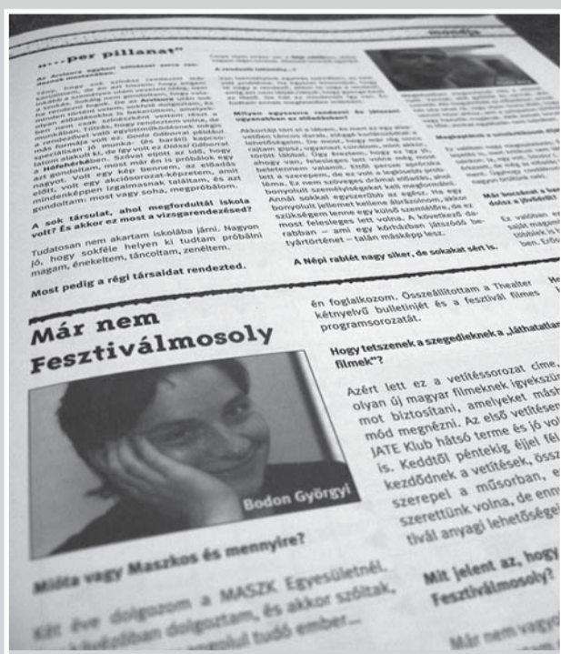
Rovatunkban napról napra visszatekintünk a 20 éves THEALTER Fesztivál múltjába az EX-STASIS néhány cikkérszletén keresztül.