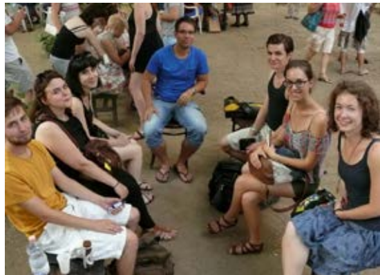
blogjr 2015