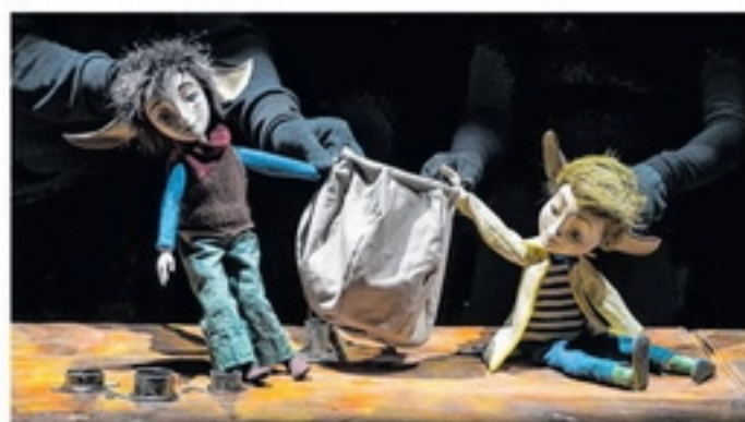
A 4–8 éveseket is megszólítja a Sündör és Niru című bábelőadás.

A díszvendég feladatai ezzel nem érnek véget: a THEALTER negyedik alkalommal hirdetett meg workshopokat hazai és határon túli, felsőfokú művészeti oktatásban részt vevő fiatalok számára. Zsótér Sándor és Soós Attila, a Trojka Színházi Társulás alapító-rendezője vezetésével idén